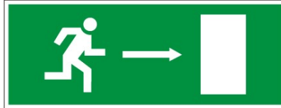
1.attēls “Evakuācijas izejas zīme”

3.3. Ja, trauksmes sirēnai skanot, izglītojamais telpā atrodas viens un neatrod nevienu pieaugušo, ir jāpamet Skolas telpas pašam – dodoties uz sev zināmo tuvāko izeju. Visas evakuācijas izejas aprīkotas ar zaļu uzlīmi “Evakuācijas izeja” (skatīt 1.attēlu).