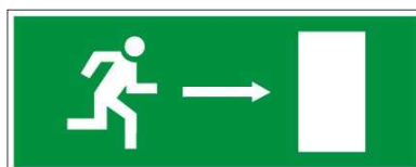
1.attēls “Evakuācijas izejas zīme”

3.3. Ja, trauksmes sirēnai skanot, izglītojamais telpā atrodas viens un neatrod nevienu pieaugušo, ir jāpamet Skolas telpas pašam – dodoties uz sev zināmo tuvāko izeju. Visas evakuācijas izejas aprīkotas ar zaļu uzlīmi “Evakuācijas izeja” (skatīt 1.attēlu).